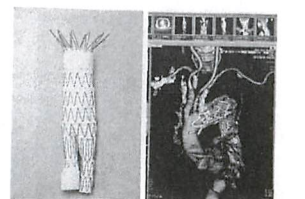
左は腹部大動脈瘤で用いるステントグラフト。右はステントグラフトを留置した大動脈のCT画像

「日本の強みは、下町の工場のようなところで作る、繊細で使い勝手の良い工業品です。残念なことに、今までは血管内治療のような最先端の医療機器に日本の技術はあまり生かされていませんでした。しかし治療環境が整ったこれからは、メイドインジャパンの医療機器を世界に発信していくことができます」と大木医師は熱く語る。